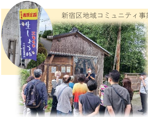
新宿区地域コミュニティ事業助成による事業「川越バスツアー」

主に四谷地域の方達が参加した日帰りツアーで、小江戸川越街散歩や昼食会、サイボクハムでのお買い物の前に、醤油工場「醤遊王国」を見学。皆さんに四谷地域センターを更に知っていただく事も出来て楽しんでもらえました。