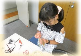
「ハロウィンリース作り」 小学生も一生懸命作っています