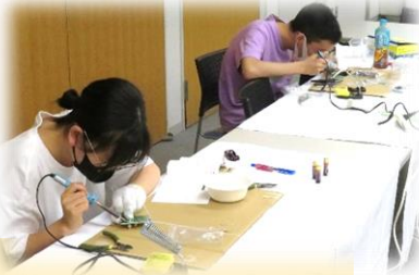
「夏休みラジオ作り講習会」真剣です！