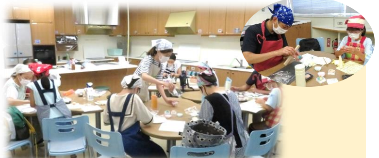
夏休みの親子体験「和菓子ねりきり作り」はパパも真剣☆