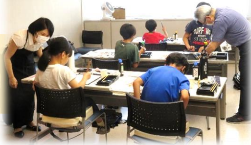
「夏休み子ども書道教室」 とっても上手で1F に展示もしました