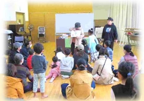
新宿区地域コミュニティ事業助成による事業「名探偵あそび」 子ども達は考える力をつけて立派な名探偵になりました！

主に四谷地域の方達が参加した日帰りツアーで、小江戸川越街散歩や昼食会、サイボクハムでのお買い物の前に、醤油工場「醤遊王国」を見学。皆さんに四谷地域センターを更に知っていただく事も出来て楽しんでもらえました。