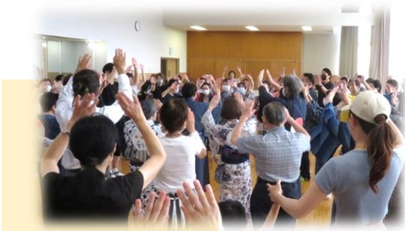
「盆踊り練習会」大人気！