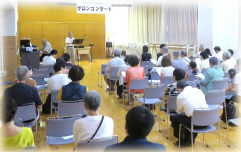
「サロンコンサート」一緒に歌も口ずさんでいます♪