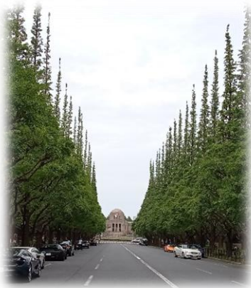
資料「四谷散歩」安本 直弘 著 協力 四谷図書館

イチヨウが芽生えたのは一九〇八 年新宿御苑にあったすべて同じイチ ヨウの木の種類から取り、育った同年 の「兄弟木」です。ちなみに外苑の イチヨウ並木は146本のうち9割の 102本が雌の木である為「兄弟姉妹木」 になります。一九二三年植え付けが開 始されたが同年発生した関東大震災 で一時中断を余儀なくされました。植 えた時は6m位だったイチヨウは今、 最も高いもので20m以上。木は今年 で115年、地域の私達にとっては大切 な子ども達なのです。明治神宮は国費 で、神宮外苑は今で言うクラウドファ ンディングで造られた大切な場所です。 これからも末永く「みんなの外苑」 心のよりどころとして出来る限り今 の姿をとどめてほしいところです。