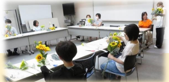
「ひまわりブーケ作り」中高生は最後の作品撮りまで上手☆